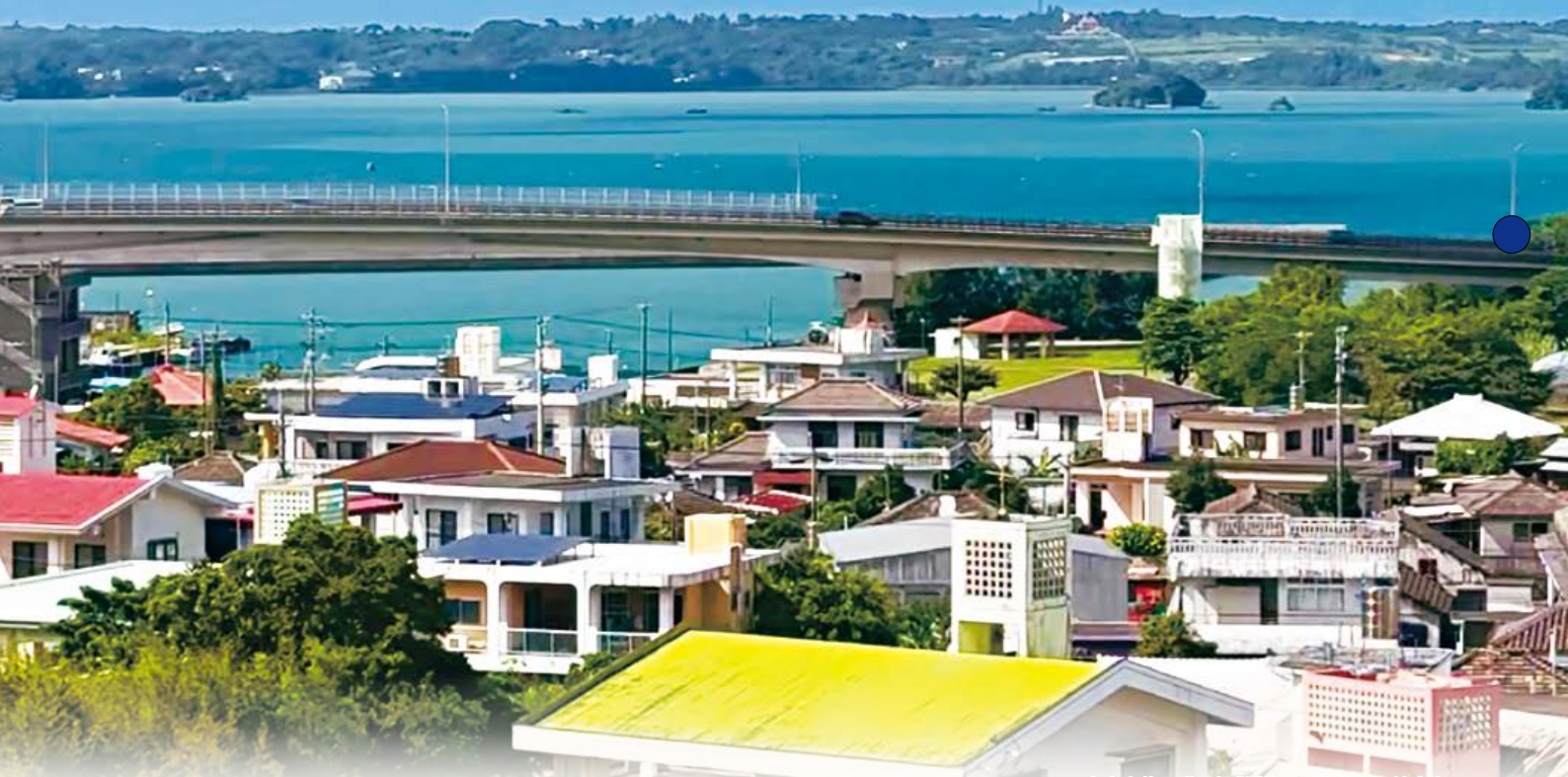
「仲尾次集落と羽地内海」