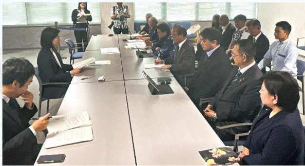
外務省沖縄事務所