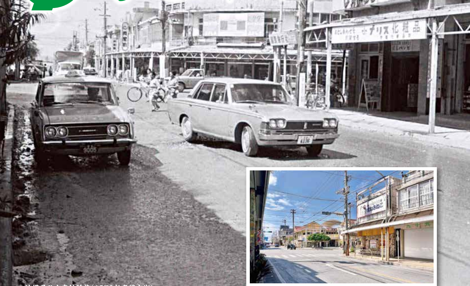
(1970年名護市街)